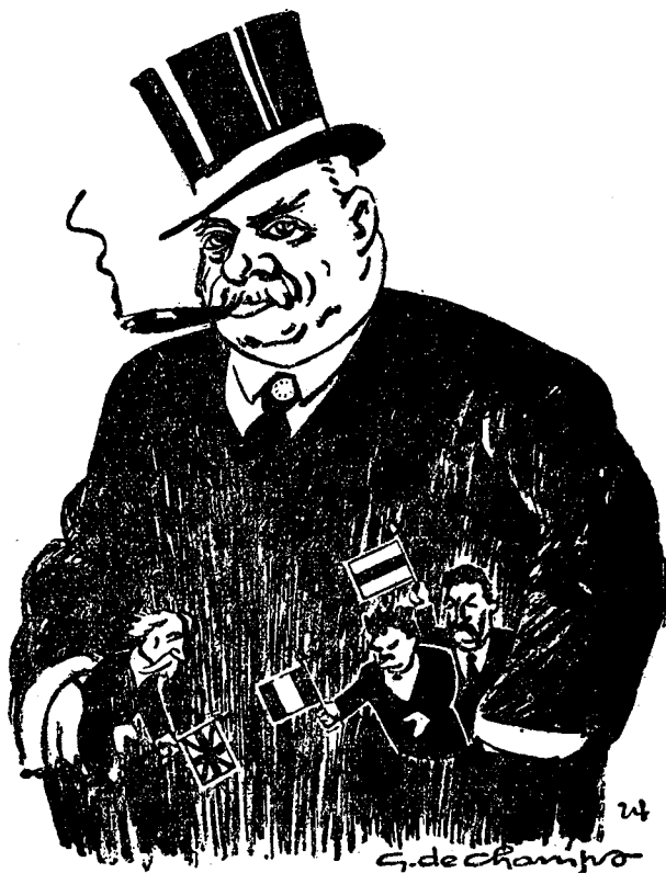
Finanskungen Pierpont Morgan.

Förenta Staternas kapitalism, dess trustar, banker och andra penninginstitutioner, är således all världens långivare. Staterna äro däremot låntagare. Varje stat har stora statsskulder. Varje stat har fått nedlåta sig att tigga Förenta Staternas kapitalister om ekonomisk hjälp. Dessa ha i regel genast varit villiga därtill, men har staterna samtidigt varit tvungna att hos dem förpanta järnvägar, skogar, gruvor, vattenfall och