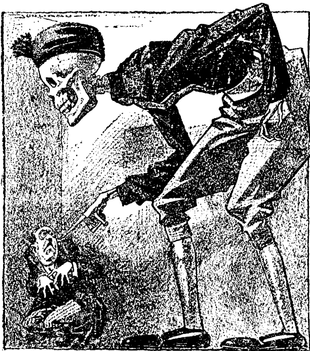
Mussolini möter ärkefascisten.

4 Man kan betrakta järnvägsmannaförbundet som oavhängigt, fastän dess styrelse i sista minuten förklarade det anslutet till den reformistiska organisationen för att om möjligt undvika upplösning.